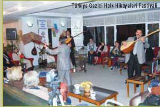
Türkiye Gezici Halk Hikayeleri Festivali