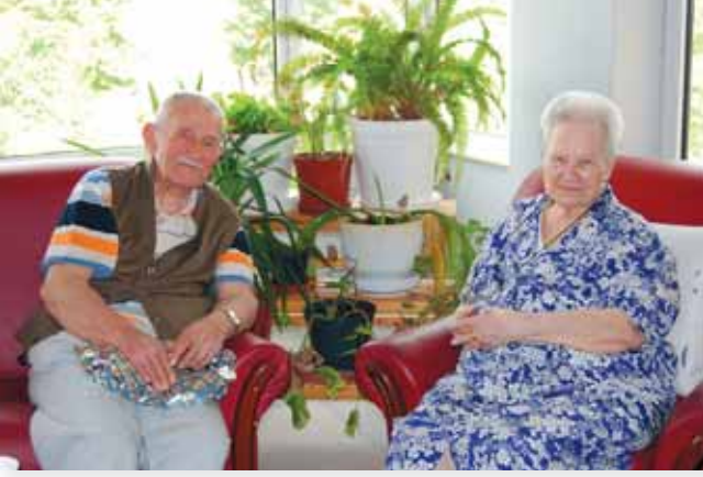
Yemek sonrası bir sohbette dostluklarımızı pekiştirdik.