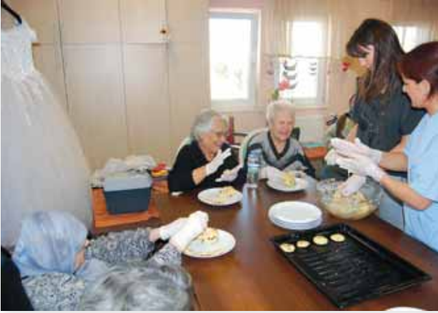
Kurabiyeler, pastalar yapıp hoşsohbetler ve çay eşliğinde afiyetle yedik.