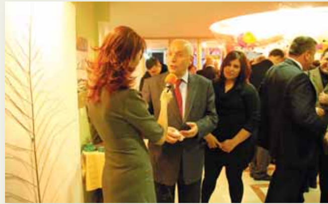
Akyurt Belediye Başkanı Sayın Gültekin Ayantaş