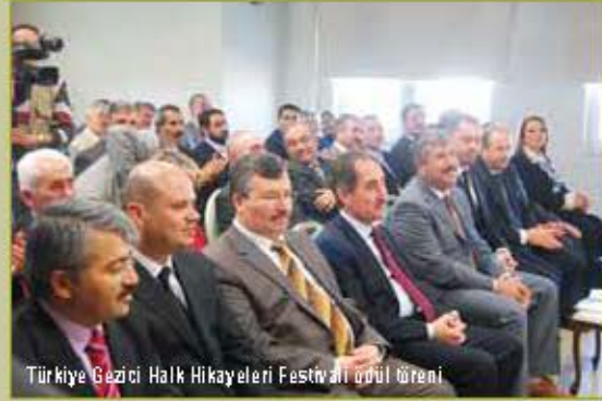
Türkiye Gezici Halk Hikayeleri Festivali ödül töreni