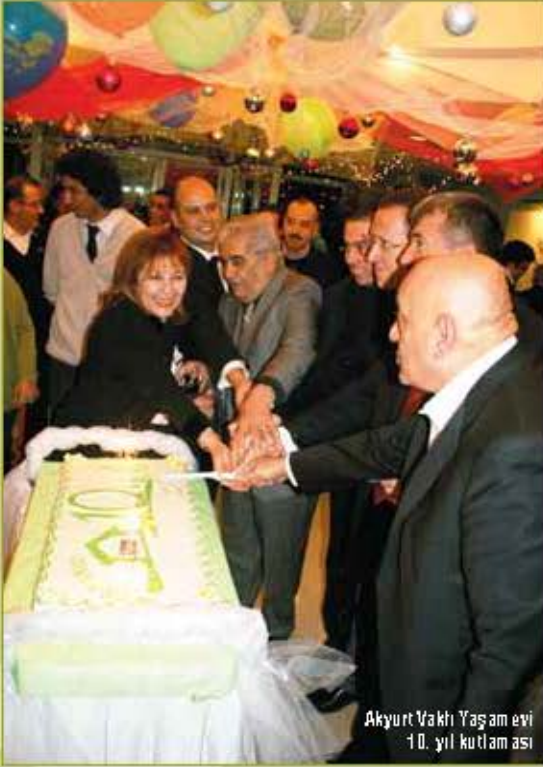
Akyurt Vakfı Yaşamevi 10. yıl kutlaması