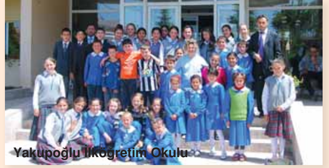
Yakupoğlu İlköğretim Okulu