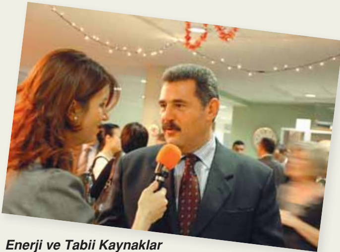
Enerji ve Tabii Kaynaklar Eski Bakanı Sayın Cumhur Ersümer