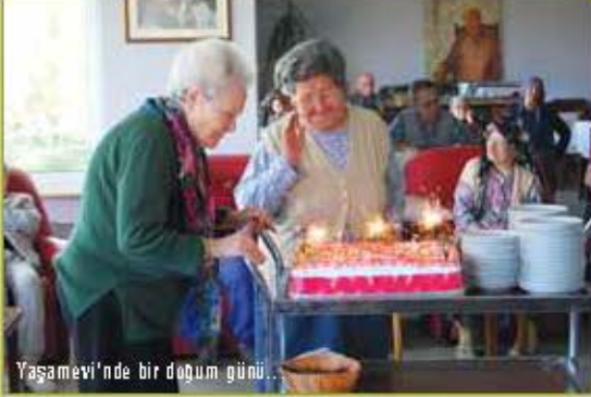
Yaşamevi'nde bir doğum günü.

Akyurt Vakfı tarafından 4 ayda bir yayımlanır. Kasım 2010 Sayı: 16