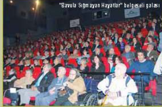
"Bavula Sığmayan Hayatlar" belgeseli galası