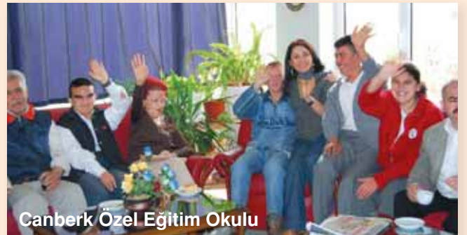
Canberk Özel Eğitim Okulu