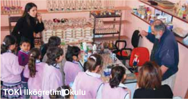
TOKİ İlköğretim Okulu