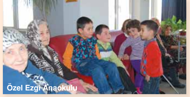
Özel Ezgi Anaokulu