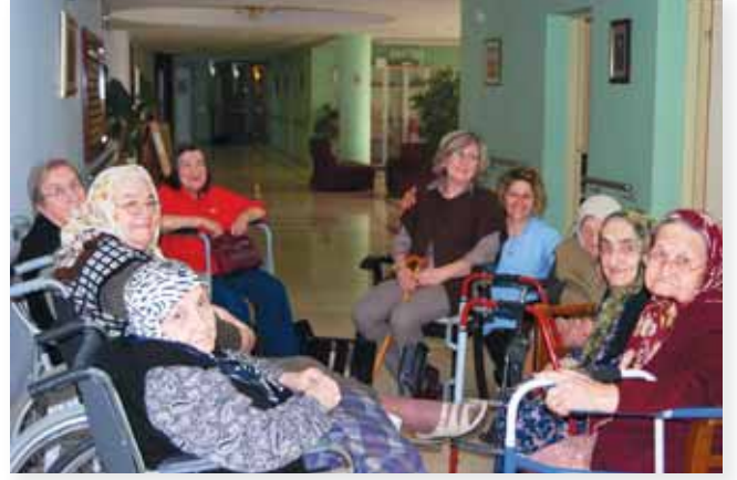
Tüm sevgilerimizi paylaştık gülerek sohbet ederek.