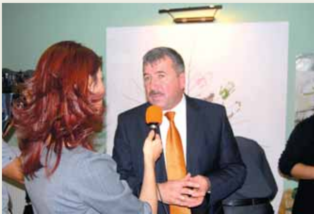
Yenimahalle Belediye Başkanı Sayın Fethi Yaşar

Bütün bunları yaşarken Vakfımız Yaşamevinde 10 yıl içinde 213 sakinimizi ağırlayarak ortalama 570.000 öğün yemek yemiştik, mutlu bir yaşamevinin sağlıklı sakinlerden oluşacağı düşüncesiyle doktorumuza 4212 kez muayene olmuş, bu süre içinde 400 adet aşı olmuştu. Bütün bunlar gerçekleşirken gönül dostlarımız, mamilerimiz, gönüllülerimiz ve gizli Kahramanlarımız hep yanımızda idi, onlara teşekkür eder ve şükranlarımızı sunarız. Sağlığımız, heyecanımız, ışığımızla Akyurt Yaşamevi'ndeyiz.